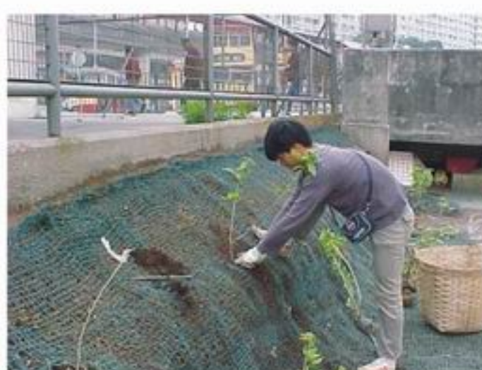
4. 灌木植物于植生袋中