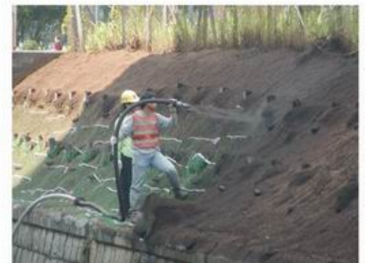
3. 基质土喷播在斜坡面上