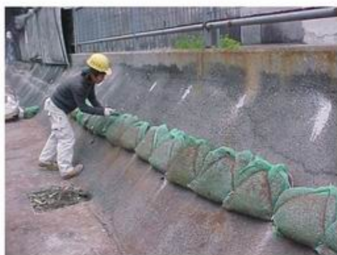
1. 固定植生袋的位置