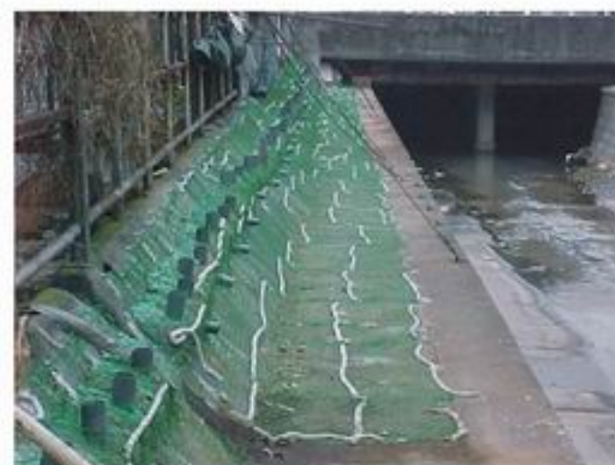
2. 草皮管固定及在斜坡上 道延植长管种加固植网及疏肥料水